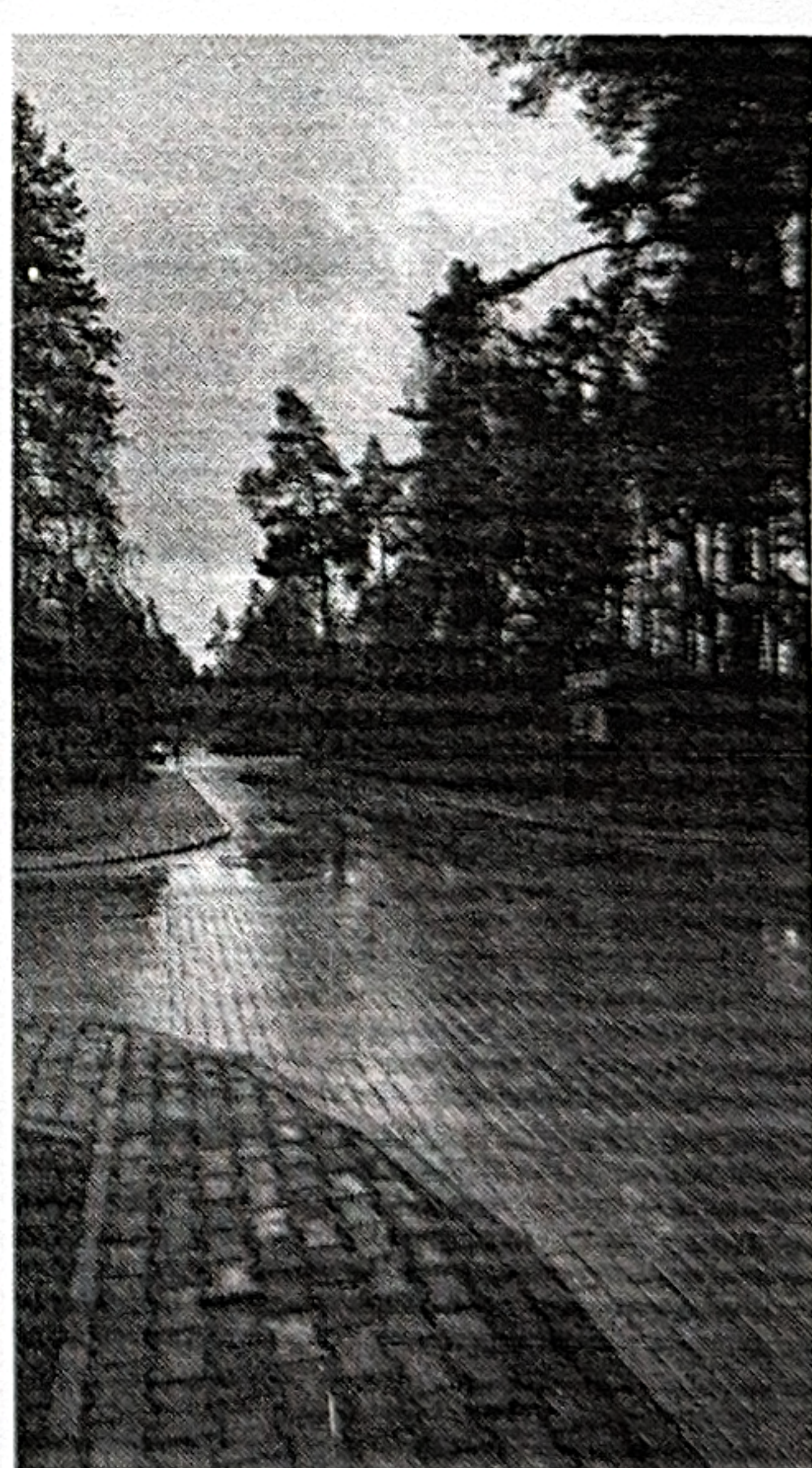
Рис. 7 Перекресток дорог № 1 и 4

Для осуществления деятельности ТСЖ в 2025 году Правление Товарищества составило проект Сметы доходов и расходов ТСЖ «Заповедный бор» на период с 01.01.25 по 30.06.25 - Приложение № ___ к Протоколу Общего собрания, а также проект Сметы доходов и расходов ТСЖ «Заповедный бор» на период с 01.07.25 по 31.12.25 - Приложение № ___ к Протоколу Общего собрания.