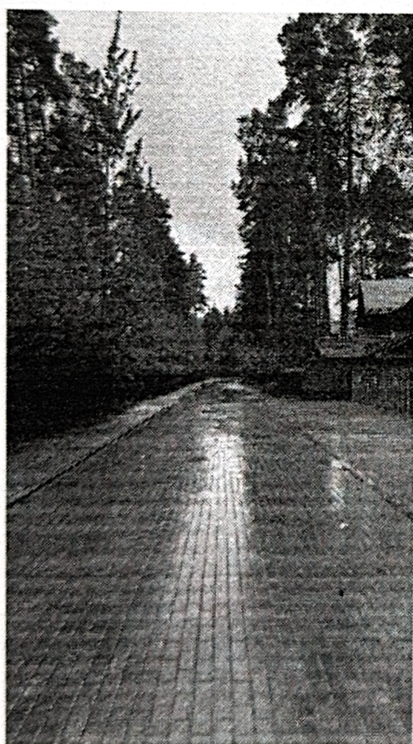
Рис. 5 Дорога № 4