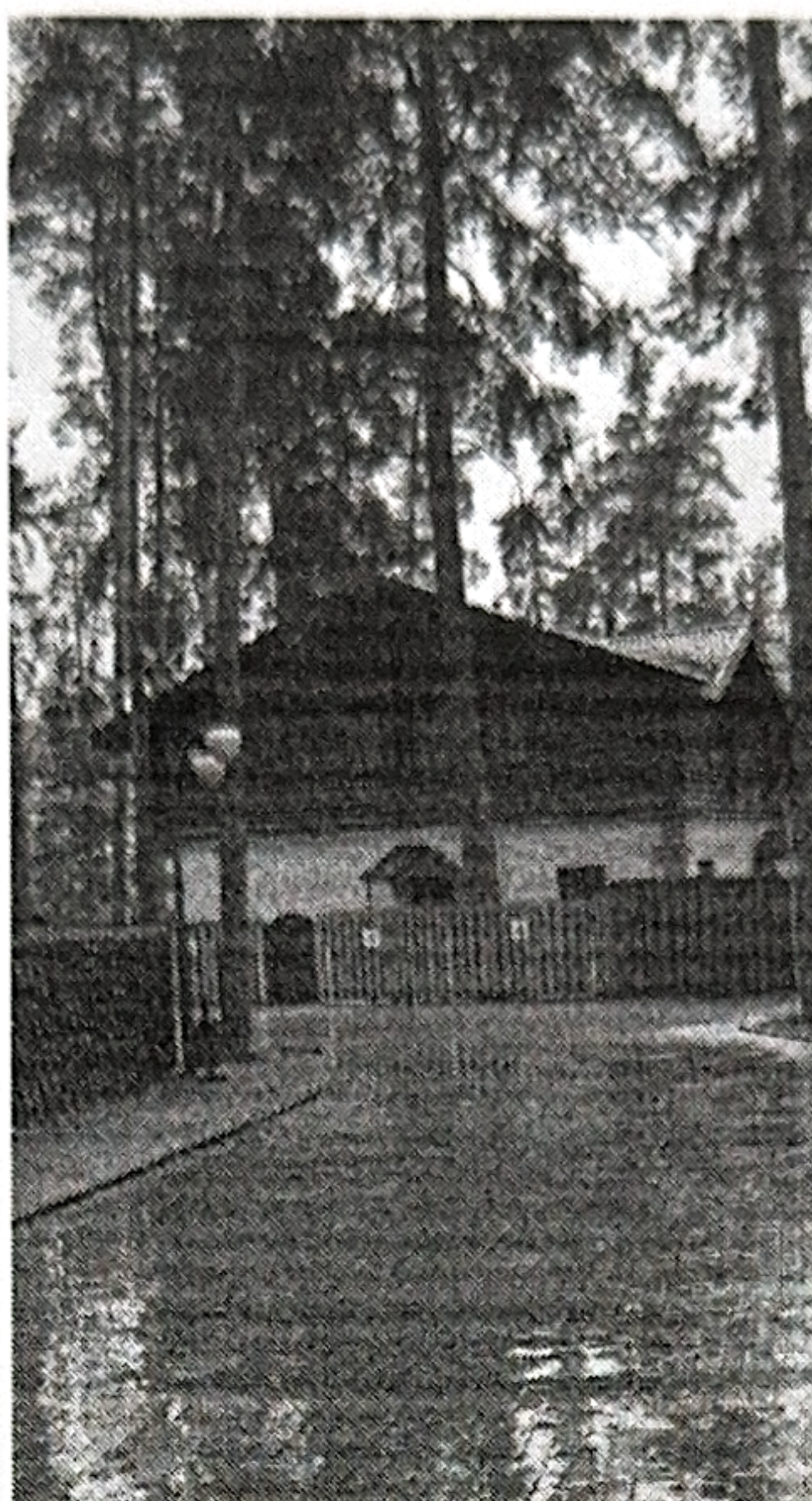
Рис. 3. Перекресток дорог № 2 и 4