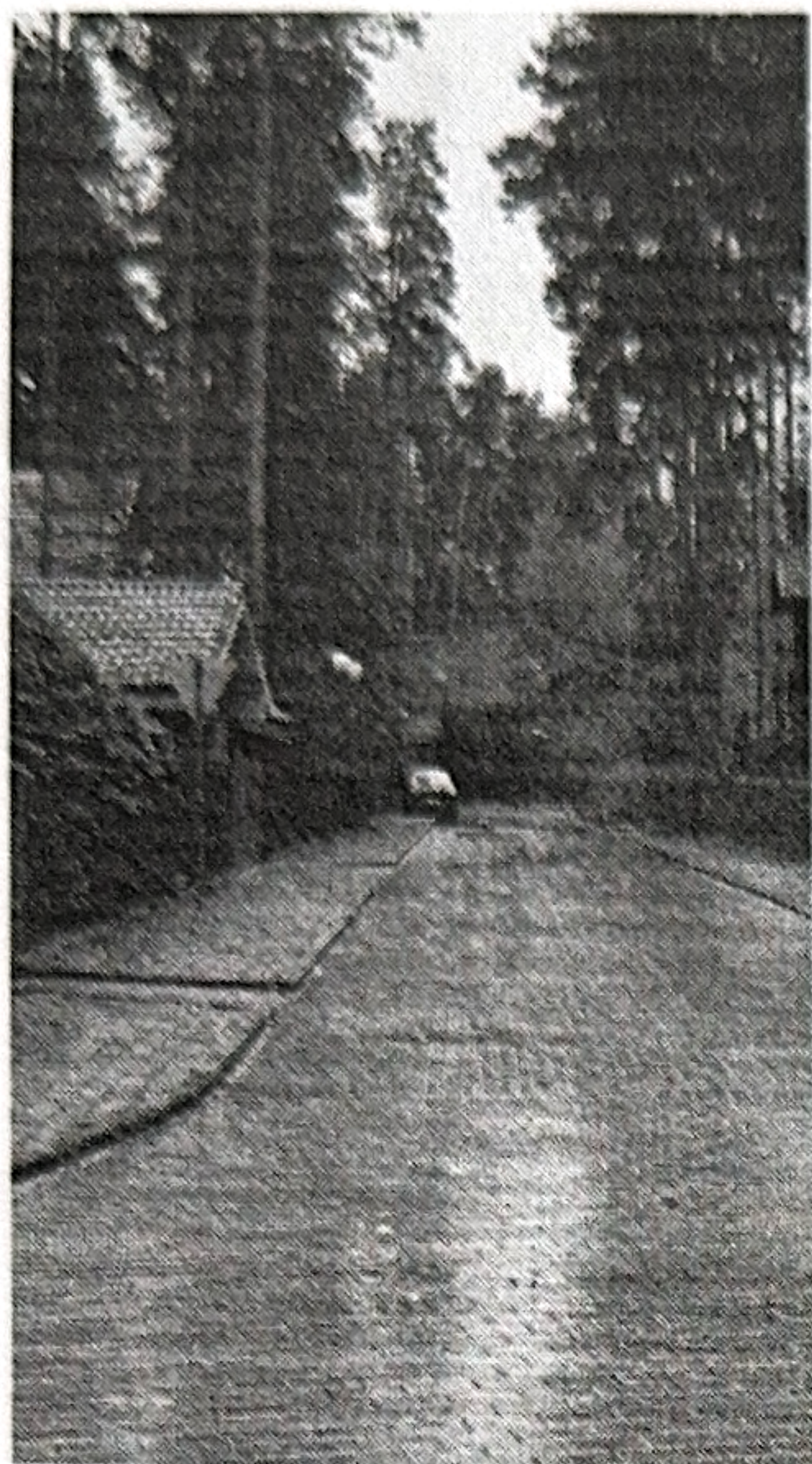
Рис. 2 Дорога № 2