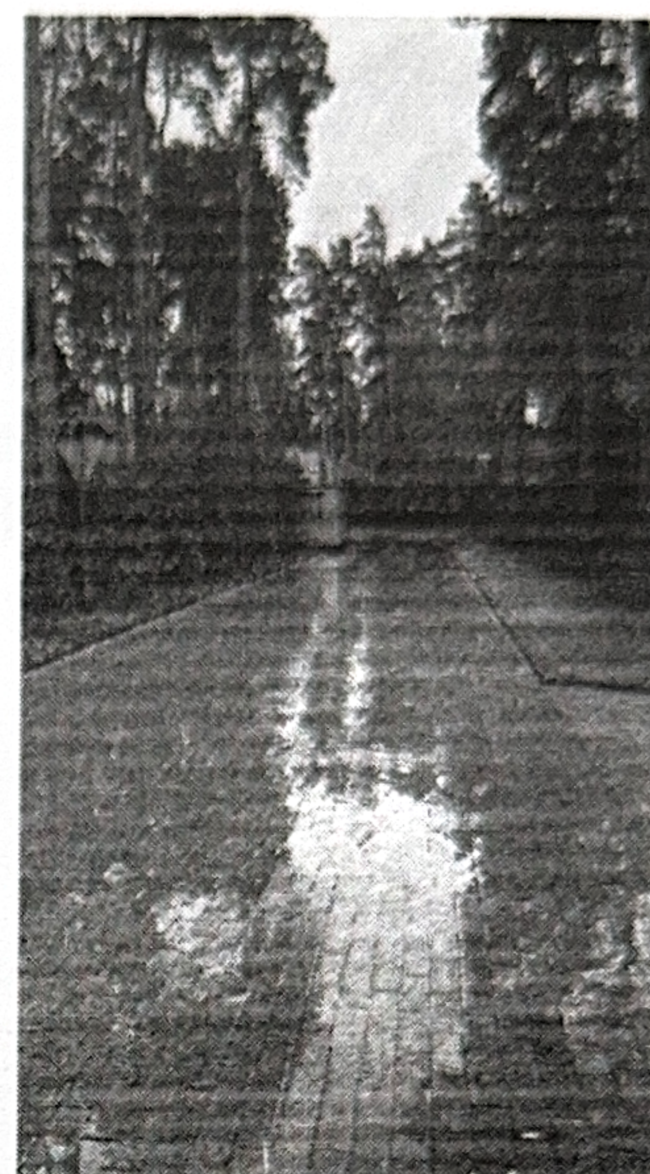
Рис. 4 Дорога № 3