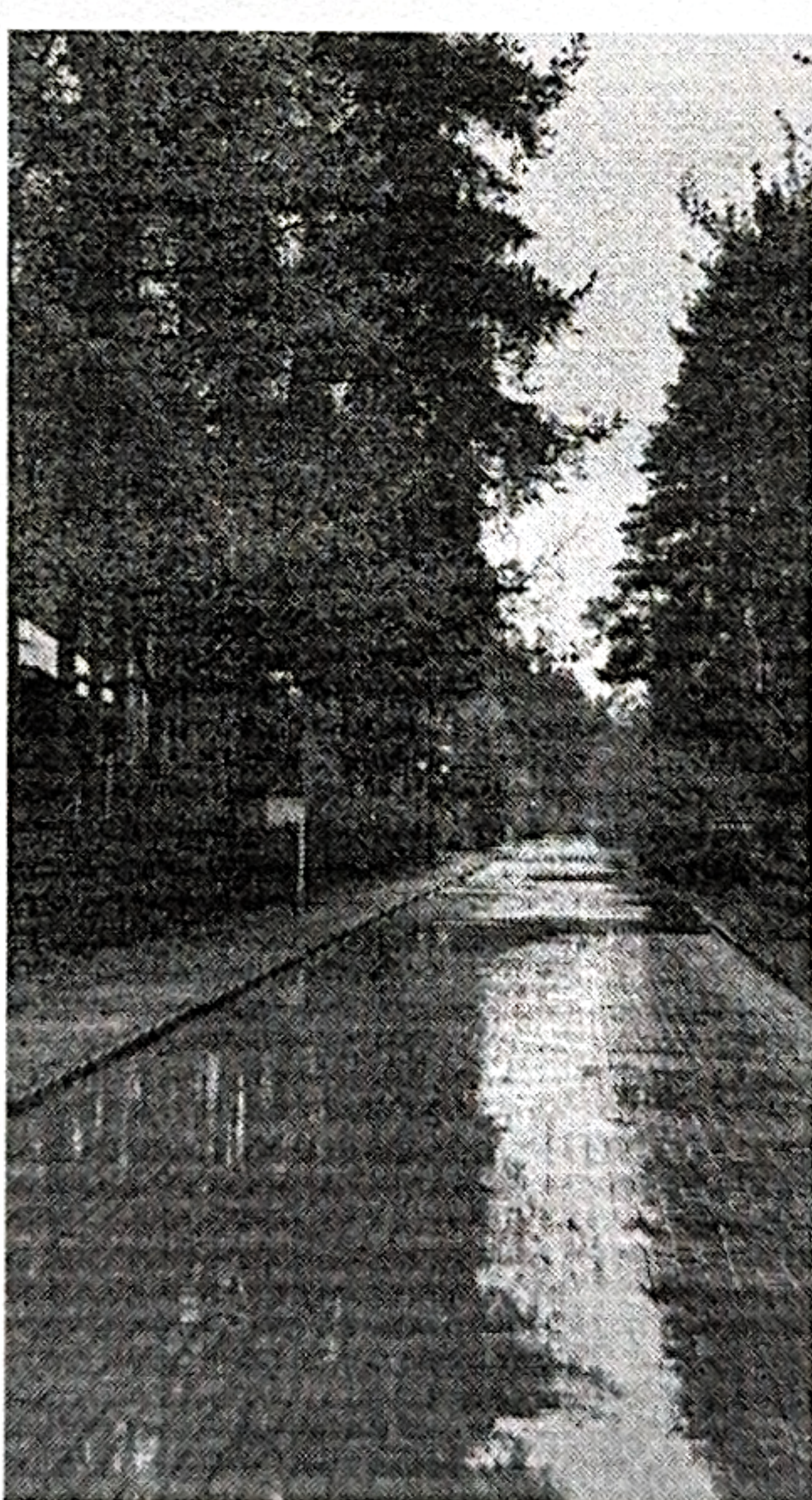
Рис. 6 Дорога № 4